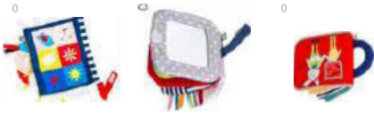
Jouets d'éveil, hochets