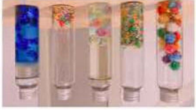
Des boîtes à remplir

Bouteilles remplies d'objets sonores (pâtes, lentilles..) ou visuels (papiers brillants, jolis tissus)