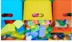
Des boîtes à remplir