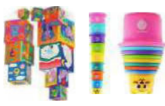
Cubes ou boîtes gigognes